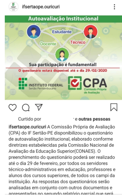
Figura 6: Publicação rede social Campus Ouricuri