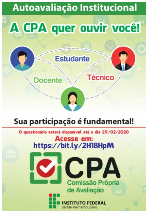
Figura 2: Cartaz utilizado para sensibilização