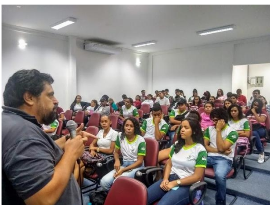
Figura 7: Encontro Comunidade acadêmica Campus Salgueiro