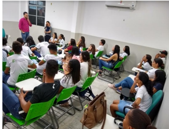
Figura 11: Encontro Comunidade acadêmica Campus Petrolina Zona Rural