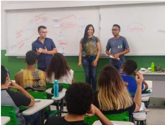
Figura 9: Encontro Comunidade acadêmica Campus Petrolina