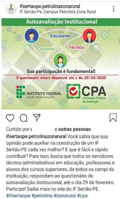
Figura 4: Publicação rede social Campus Zona Rural