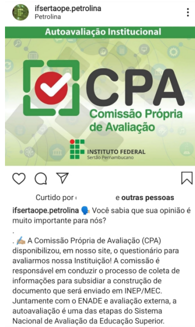
Figura 5: Publicação rede social Campus Petrolina