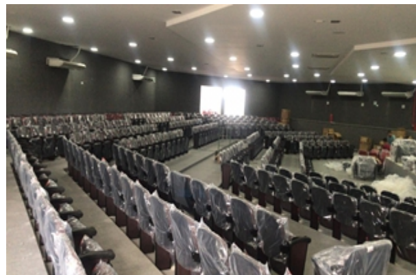
Figura 12: Auditório do Campus Ouricuri com instalação das poltronas