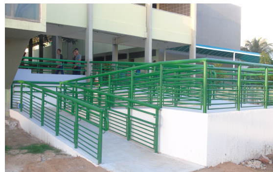
Figura 2: Rampas de Acessibilidade