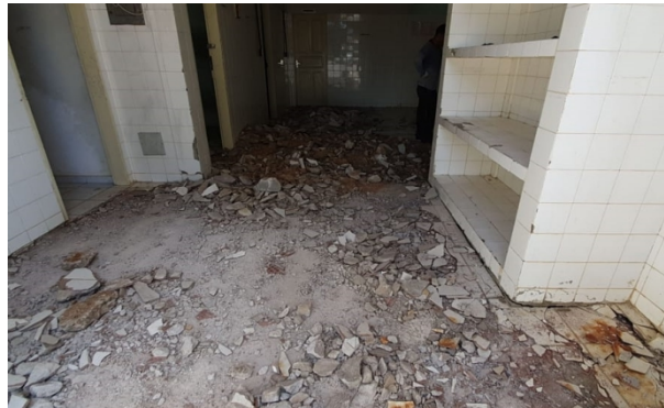
Figura 8: Restaurante CPZR