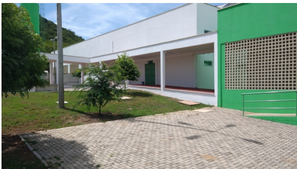
Figura 9: Área Externa Campus CST

Em relação ao Campus de Serra Talhada, por ser um campus construído recentemente, foram realizados apenas os serviços de reparo, pintura e manutenção das estruturas, tubulações e equipamentos. A seguir, são apresentadas fotos do referido campus após a reforma: