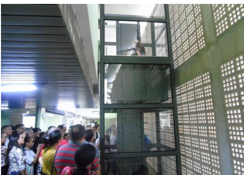
Figura 1: Plataformas Elevatórias

No campus Petrolina destaca-se entre os anos de 2018-2020 a construção quatro plataformas elevatórias, corrimãos de acessibilidade, rampas e reformas do banheiros adaptados m conformidade com a ABNT NBR 9050 para acessibilidade para melhor atender o público com necessidades específicas; implementação de identidade visual , implantação de sombrites; cabeamento estruturado para fornecer internet segura e com maior velocidade; manutenção preventiva e corretiva intensiva na frota de veículos oficiais que proporciona visitas técnicas com segurança; reformas predial, hidrossanitárias e elétricas em blocos e banheiros ; reestruturação e ampliação da rede de energia elétrica do campus Petrolina; reformas para recuperação predial (estruturas de concreto, fachadas, tetos, portas, fechaduras, conexões para banheiros, rebocos e pinturas); construção do auditório teatro, com capacidade para acomodar 620 pessoas para assistirem atividades científicas, culturais, artísticas e musicais ; reforma nos estacionamentos de veículos dos servidores e visitantes; reformas das salas dos professores das coordenações dos cursos superiores,aquisição diversos equipamentos e mobiliários e início da obra de implementação do refeitório no local onde funcionava o auditório central e migração da telefonia para fibra optica.