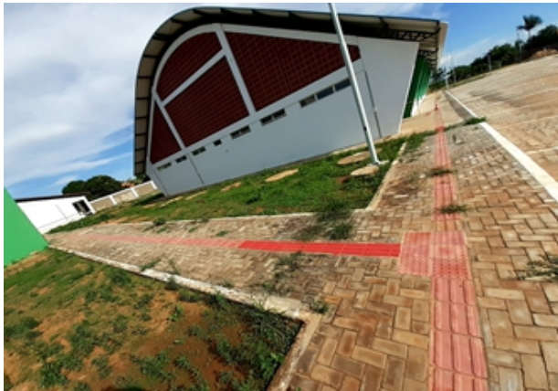
Figura 13: Quadra Poliesportiva do Campus Ouricuri estacionamento e pisos sinalizados para acessibilidade