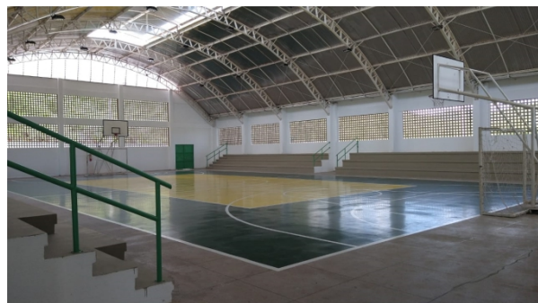
Figura 10: Quadra Poliesportiva CST