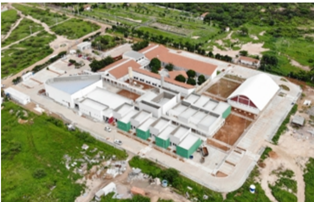
Figura 11: Vista Aérea do Campus Ouricuri com construção dos novos laboratórios quase concluída

Cabe ressaltar que, no tocante às obras de construção, reforma e adaptação, alguns espaços já se encontram concluídos e outros em fase de conclusão. Ainda cabe pontuar que, aliado a melhorias na infraestrutura, nos anos de 2019/2020 foram adquiridos diversos equipamentos e mobiliários para equipar tais instalações.