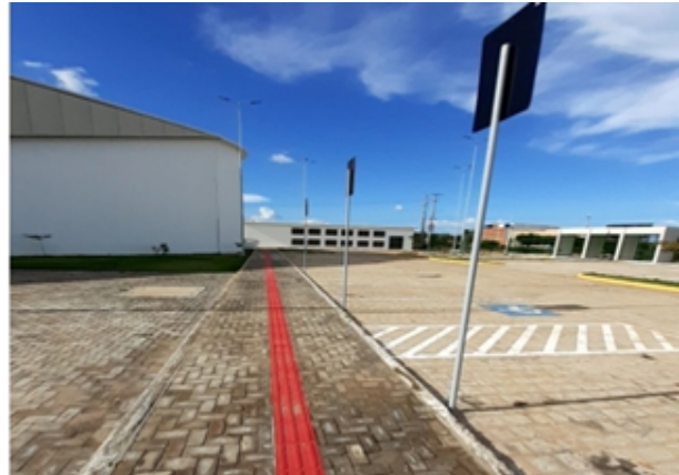
Figura 14: Pisos de sinalização para acessibilidade e com vagas reservados para deficientes e idoso