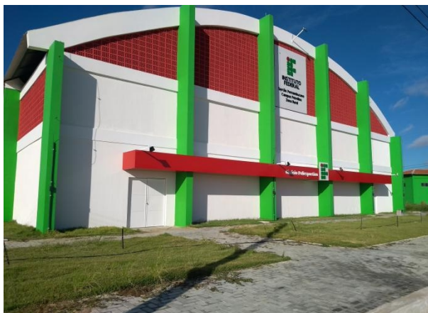
Figura 5: Quadra Poliesportiva CPZR

Em relação a infraestrutura, no campus Petrolina Zona Rural no ano de 2018 foi construído o bloco da sala dos professores e foi concluído a reforma da residência estudantil; No ano de 2019 a reforma da quadra poliesportiva foi concluída; No ano de 2020: teve início a reforma do refeitório adaptando-o às condições necessárias para enfrentamento da COVID-19 e atendimento às políticas de acessibilidade; Aquisição e instalação de sistema gerador de energia solar capaz de suprir às necessidades do Campus; Início de melhorias na infraestrutura da padaria com readequações para atender os padrões higiênico-sanitários dos métodos de produção. Outras obras de melhorias foram iniciadas e finalizadas durante esse período e outras estão em andamento, a exemplo do laboratório de Hidráulica e Irrigação que começou em 2019 e estão em andamento.