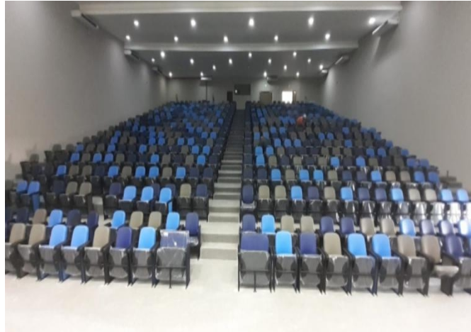
Figura 4: Visão Interna do Auditório CP