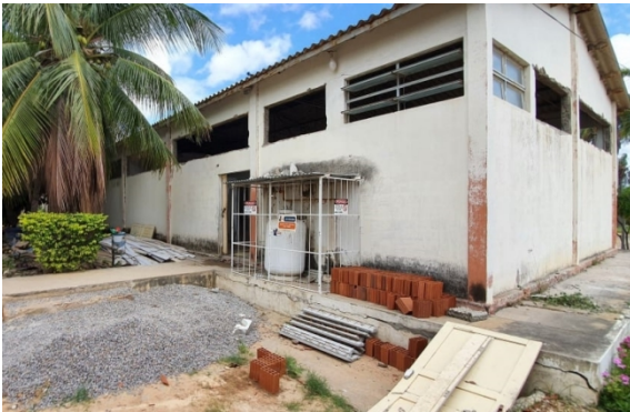
Figura 7: Padaria CPZR