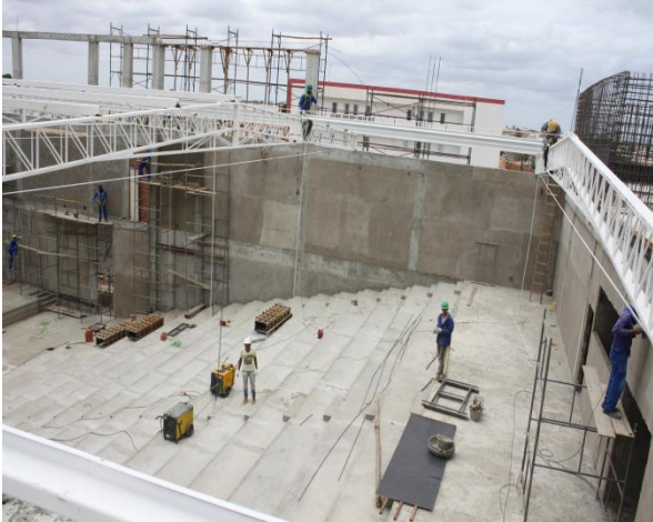
Figura 3: Início da Construção do Auditório CP