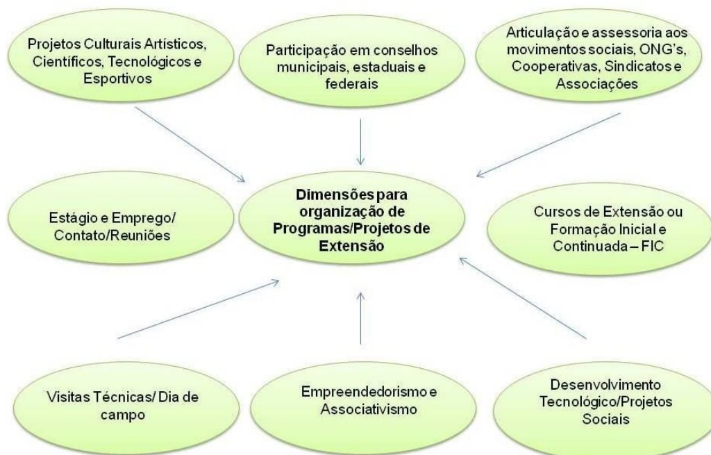
Figura 3 – Dimensões para a organização de Programas e Projetos de Extensão.

No PDI (2014-2018, p. 56) 18 , a organização dos Programas e Projetos, considerando as experiências dos Institutos Federais, deve observar as “dimensões operativas que transversalizam as áreas do conhecimento e os eixos tecnológicos norteadores [...].(CONIF, 2013, p.16). Essas dimensões são descritas no PDI e envolvem o que destaca a figura a seguir: