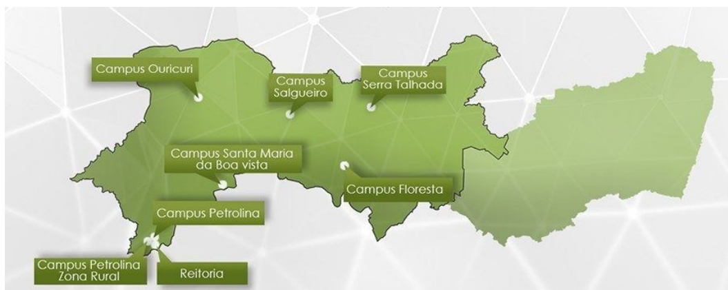
Figura 1 – Área de abrangência do IF Sertão.

O Instituto Federal de Educação, Ciência e Tecnologia do Sertão Pernambucano foi criado pela Lei Nº 11.892, de 29 de Dezembro de 2008, com sede (Reitoria) em Petrolina. Atualmente, conta com sete Campi: Petrolina Zona Rural, Petrolina, Floresta, Salgueiro, Ouricuri, Santa Maria da Boa Vista e Serra Talhada. Possui, ainda, três Centros de Referência, sediados respectivamente em Petrolândia, Afrânio e Sertânia.