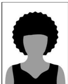
Figura 01 - Modelo de foto frontal